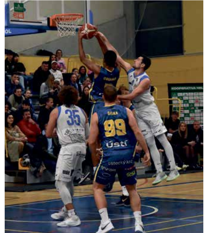
Basketbalisté BK Olomoucko si užívají dosud nejlepší sezónu v klubové historii.

„Olomoucko bylo lepší než my, vyhrálo zaslouženě. V poslední čtvrtině jsme vedli, tentokrát se nám náskok udržet nepodařilo. Rozhodly dvě trojky Evanse v závěru. Do té doby nebyl příliš vidět, ale zůstal volný a ukázal svoji kvalitu,“ řekl Tomáš Reimer, trenér Ústí nad Labem. ■