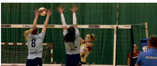
Volejbalistky VK Šantovka se prohrály na Olympu sesunuly na druhé místo.

Rozhodčí: Vachutka, Olt. Čas: 126 min. Diváků: 100.