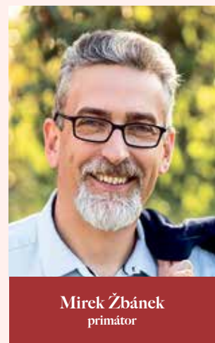
Mirek Žbánek primátor

Ptejte se vedení města Olomouce na e-mailové adrese otevrenaradnice@hanackyvecernik.cz a my Váš dotaz necháme zodpovědět!