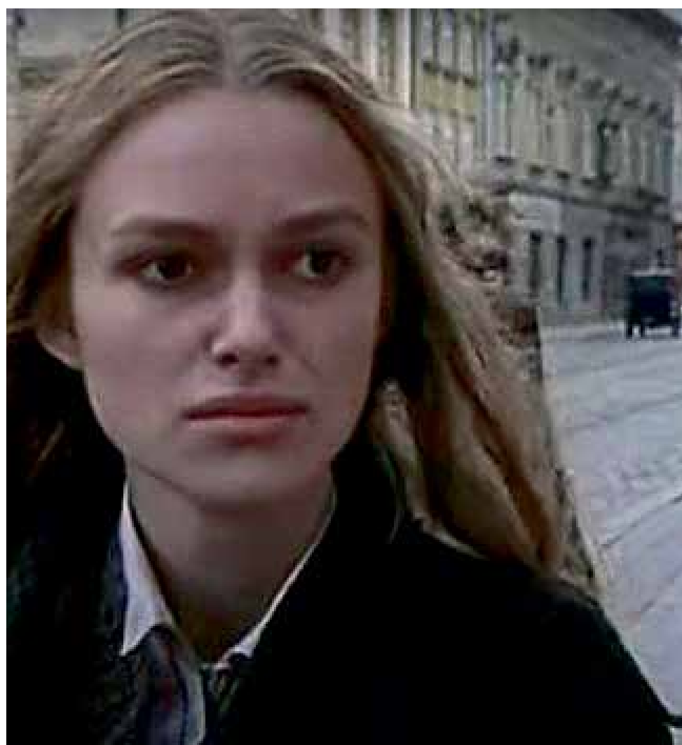
Keira Knightley na Třídě 1. máje ve filmu Doktor Živago