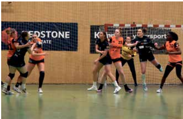
Házenkářky DHK Zora Olomouc zvídaly derby ve Zlíně.